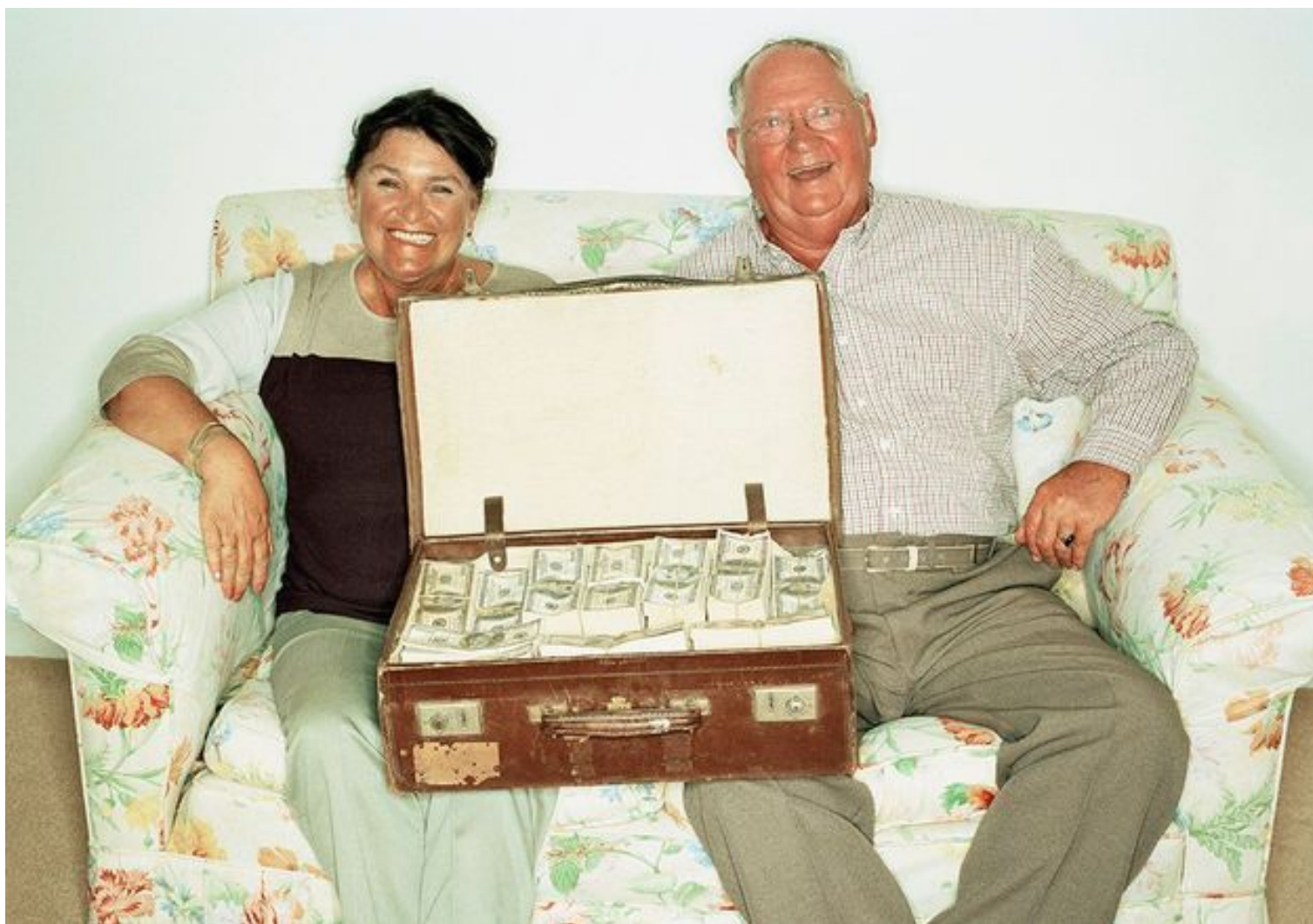
Argent dans le couple : 7 conseils d'expertes pour garder son autonomie